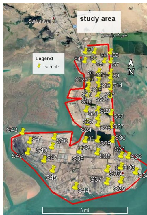
شکل ۱- داده های برداشت شده از منطقه مورد مطالعه.

جهت تعیین ایستگاههای مطالعاتی داشتن اطلاعات کافی از شرایط منطقه لازم و ضروری است.