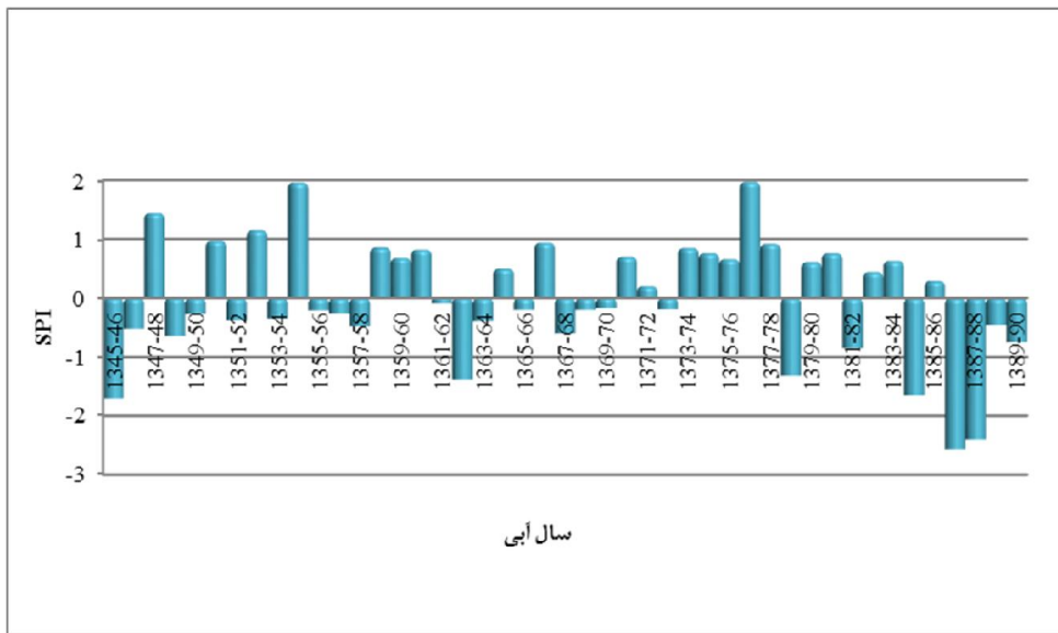
شکل ۲- نمایش SPI سالانه در ایستگاه سینوپتیک دزفول

بر اساس شاخص PNPI و در سال های آبی (۸۸-۱۳۸۷، ۸۷-۱۳۸۶) خشکسالی بسیار شدید رخ